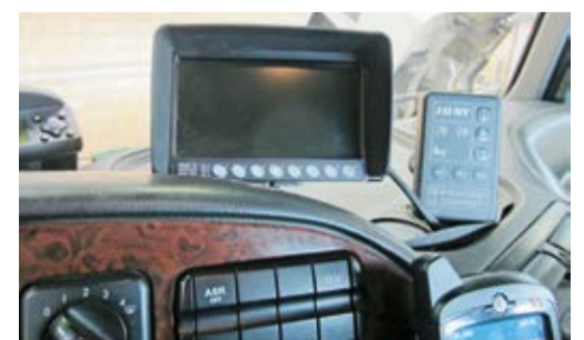
En haut: caméra arrière En bas: moniteur LED