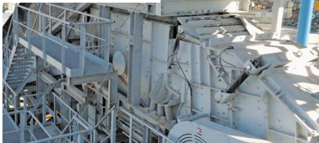
Installation de concassage fixe avec 129 points de graissage