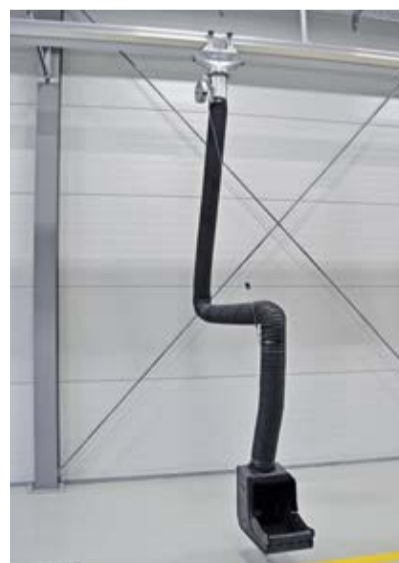
A gauche: pont élévateur 4 colonnes Slift En haut: bras d'aspiration inférieur s.tec A droite: rail d'aspiration s.tec