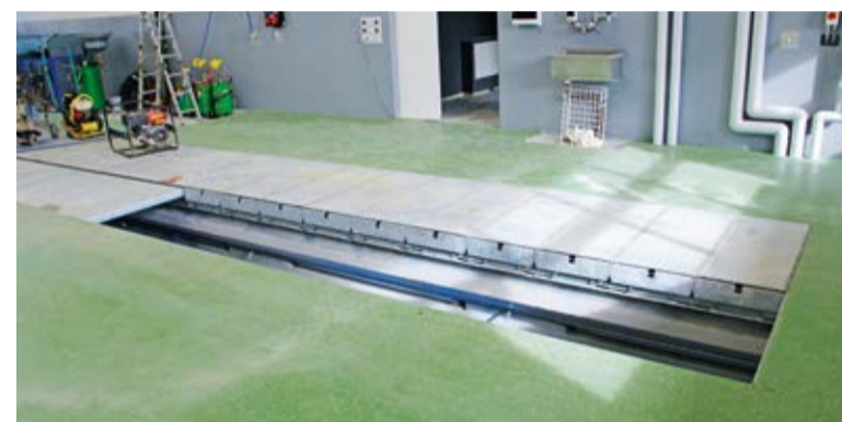
Couverture de fosse Blitz ouverte