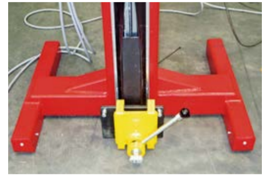
En haut: colonnes mobiles pour conteneurs En bas: quick lock