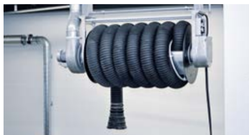
Enrouleur d'aspiration de gaz d'échappement s.tec