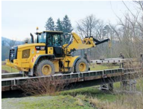
Chargeuse sur pneus CAT 930K d'armasuisse

« Critères d'attribution rigoureux satisfaits »