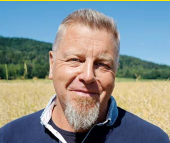
Luginbühl Fahrzeugtechnik AG 40 spannende Jahre

Seit mittlerweile mehr als 40 Jahren engagieren wir uns mit unseren Mitarbeitern, Produkten und Dienstleistungen im gesamten Mobilitätsmarkt. Es freut mich, dass uns so viele Kunden, Lieferanten und eine stattliche Anzahl von Mitarbeitenden über all die Jahre so treu gefolgt sind. Unser Leitsatz «Ihre Wirtschaftlichkeit ist unser Antrieb» ist aktueller denn je und verpflichtet uns täglich.